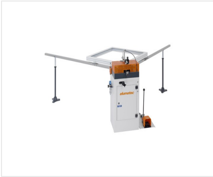
Cianfrinatrice per angoli EP 120