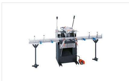
Pantografo a mandrino singolo AS 170/10