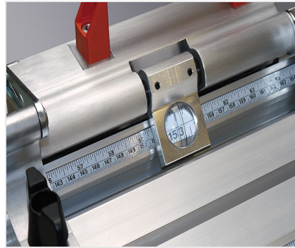
Sistema di battuta e misurazione AMS 200