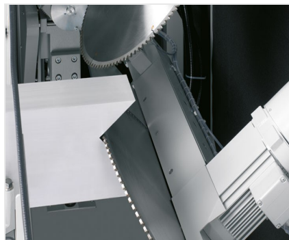
Troncatrice intestatrice AKS 134/64