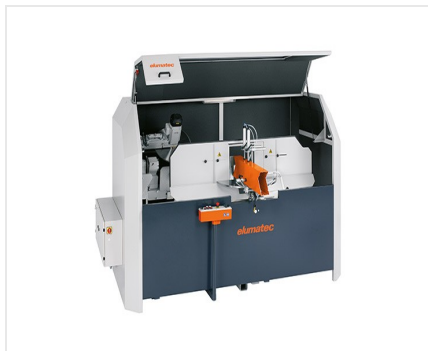
Troncatrice intestatrice AKS 134/64