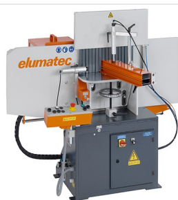
Fresatrice intestatrice AF 223/01