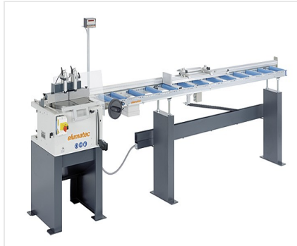
台式锯床TS 161/21 + MMS 200