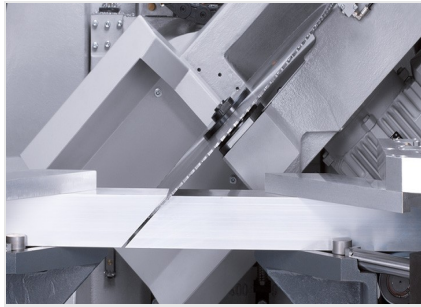
型材加工中心 SBZ 630