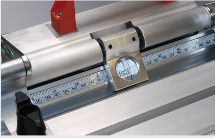
长度定位和测量系统 MMS 100