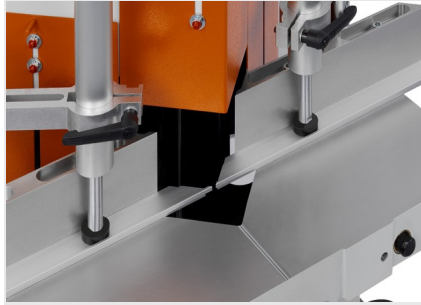
KS 101/30 V型切割机