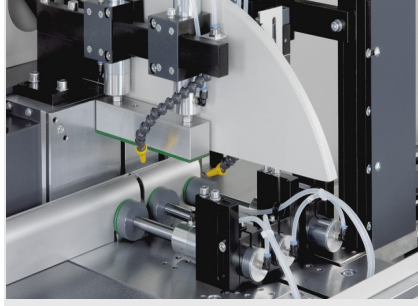
Otomatik Testere SAS 142/44