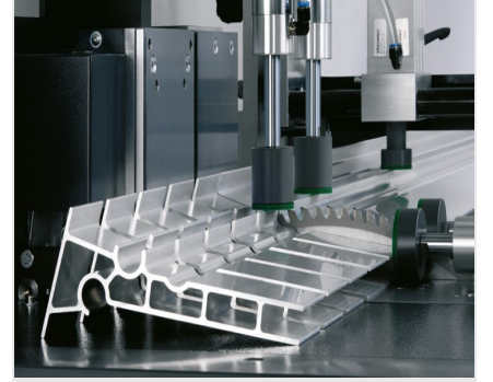
Otomatik Testere SAS 142/44