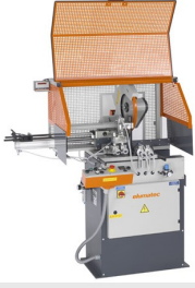
Otomatik Testere SA 73/36