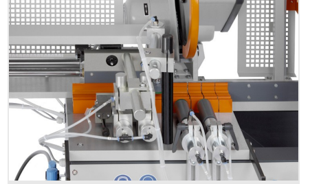
Otomatik Testere SA 73/36