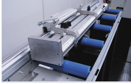
Dayama ve Ölçüm Sistemi MMS 200