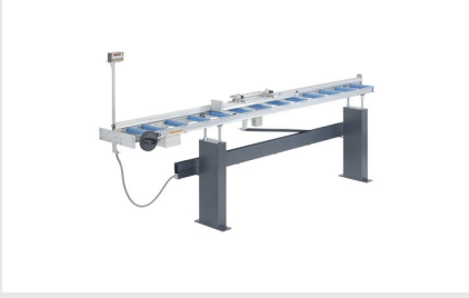
Dayama ve Ölçüm Sistemi MMS 200