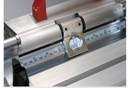
Dayama ve Ölçüm Sistemi MMS 200