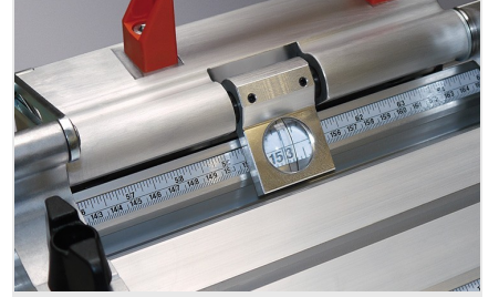
Dayama ve Ölçüm Sistemi MMS 200