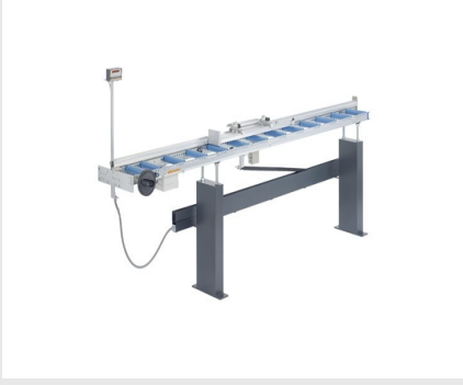
Dayama ve Ölçüm Sistemi MMS 200