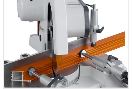
Tek Başlı Testere MGS 73/33