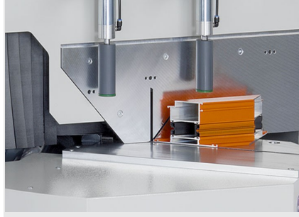
Tek Başlı Testere MGS 105