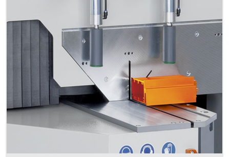
Tek Başlı Testere MGS 105