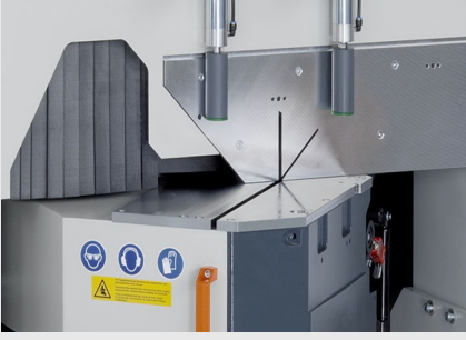
Tek Başlı Testere MGS 105