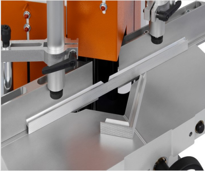
Uç Kesme ve Ayırma Testeresi KS 101/30