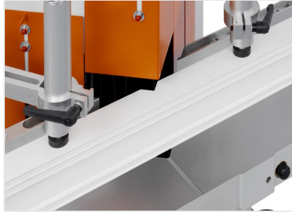
Uç Kesme ve Ayırma Testeresi KS 101/30