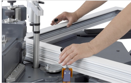
Köşe bağlantı presi EP 124/20