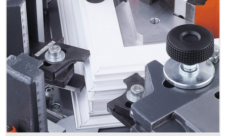
Köşe bağlantı presi EP 124