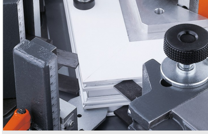
Köşe bağlantı presi EP 124