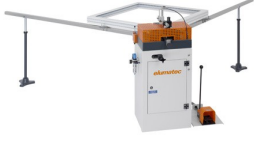
Köşe bağlantı presi EP 120