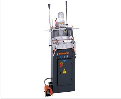
Tek Motorlu Kopya Freze AS 70/44