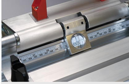
Dayama ve Ölçüm Sistemi AMS 200