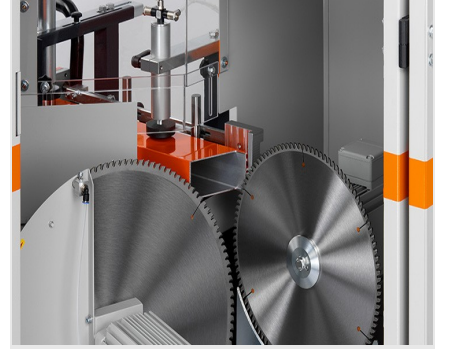
Profil Alıştırma Makinesi AKS V-550