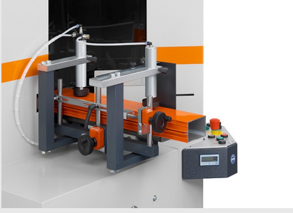
Profil Alıştırma Makinesi AKS V-550