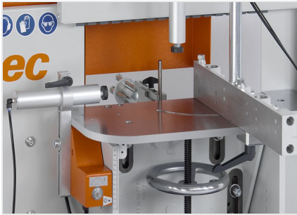
Orta Kayıt Kerme Makinesi AF 223/01