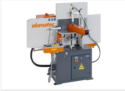
Orta Kayıt Kerme Makinesi AF 223/01