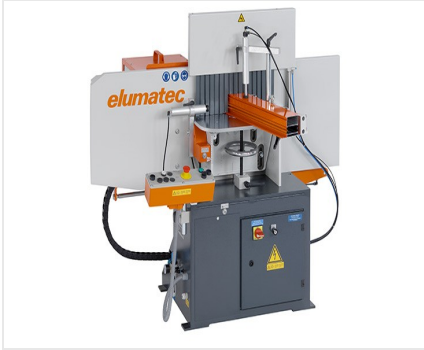
Orta Kayıt Kerme Makinesi AF 223/01