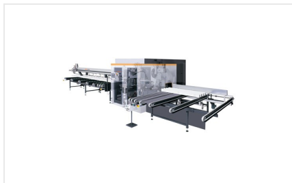
Обрабатывающий центр SBZ 631