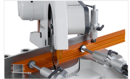
Ускоренная пила MGS 73/33