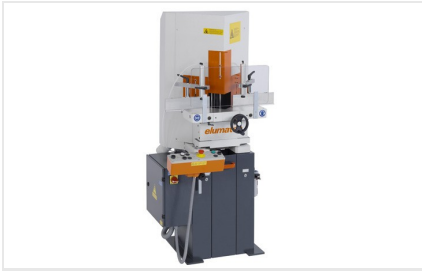
Пила для клиновых и торцевых вырезов KS 101/30