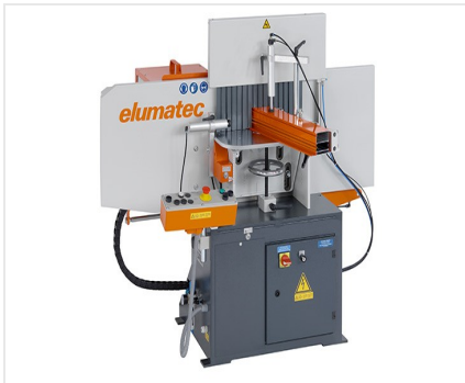
Фрезерный станок для фрезерования торцов AF 223/01