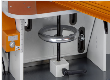
Фрезерный станок для фрезерования торцов AF 223/01