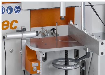
Фрезерный станок для фрезерования торцов AF 223/01