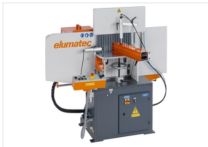
Фрезерный станок для фрезерования торцов AF 223/01