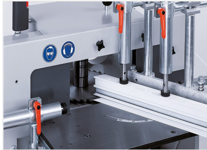
Фрезерный станок для фрезерования торцов AF 222/02