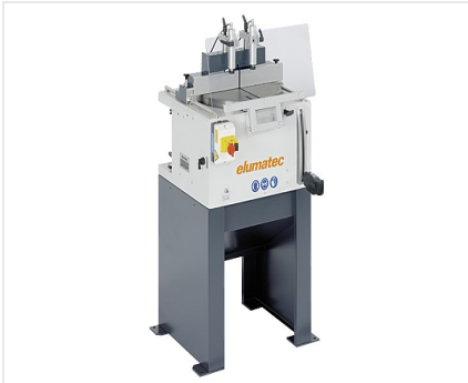
Máquina de corte auxiliar TS 161/21