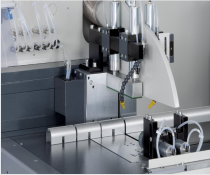
Máquina de corte automática SAS 142/44