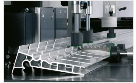
Máquina de corte automática SAS 142/44