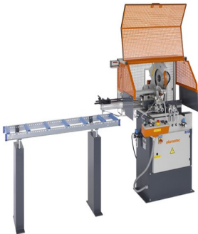
Máquina de corte automática SA 73/36