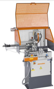
Máquina de corte automática SA 73/36