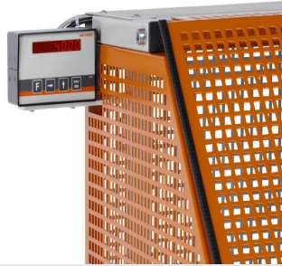
Máquina de corte automática SA 73/36