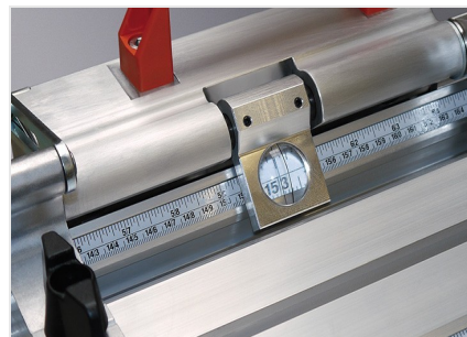
Sistema de batente e medição MMS 200