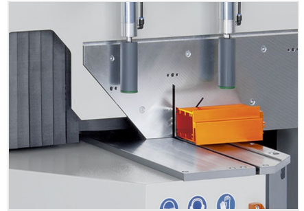
Máquina de corte angular MGS 105