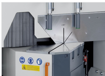
Máquina de corte angular MGS 105