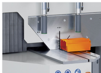
Máquina de corte angular MGS 105