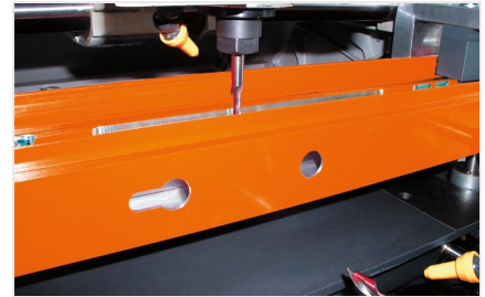
Fresa-copiadora de 3 cabeças KF 178/10