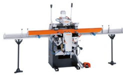
Fresa-copiadora de 3 cabeças KF 178/10