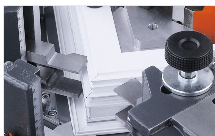
Máquina de cravar cantos EP 124