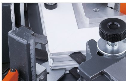
Máquina de cravar cantos EP 124