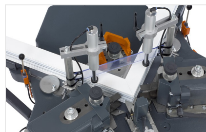
Máquina de cravar cantos EP 124