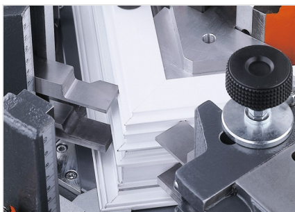
Máquina de cravar cantos EP 124