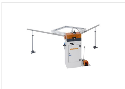
Máquina de cravar cantos EP 120