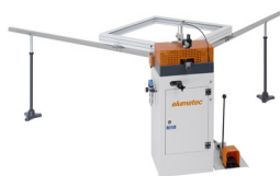
Máquina de cravar cantos EP 120