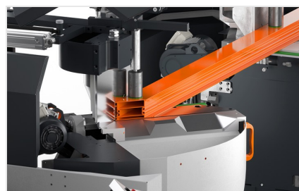
Máquina de corte de duas cabeças angulares DG 104