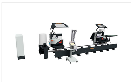
Máquina de corte de duas cabeças angulares DG 104 + E 590