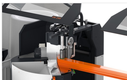
Máquina de corte de duas cabeças angulares DG 104