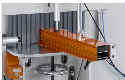
Fresa de malhetar AF 223/01