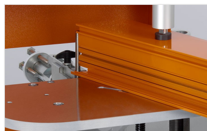
Fresa de malhetar AF 223/01