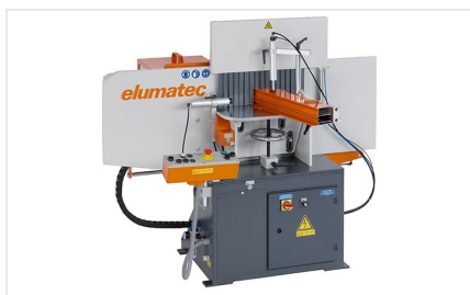
Fresa de malhetar AF 223/01