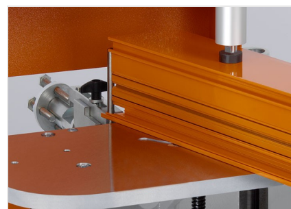
Fresa de malhetar AF 223/01