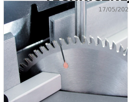
Piła stołowa TS 161