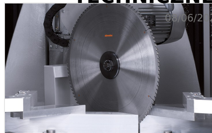
Centrum obróbcze profili SBZ 631