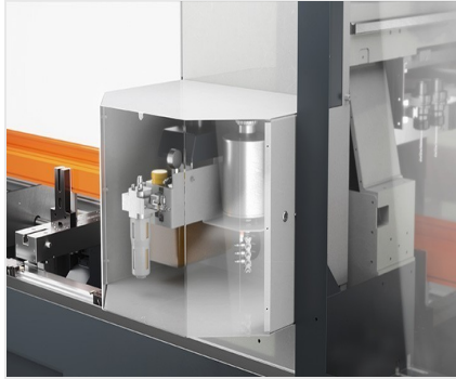
Centrum obróbcze profili SBZ 141