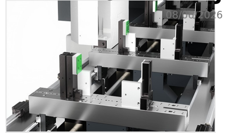
Centrum obróbcze profile SBZ 141