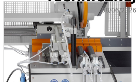
Automat do cięcia SA 73/36