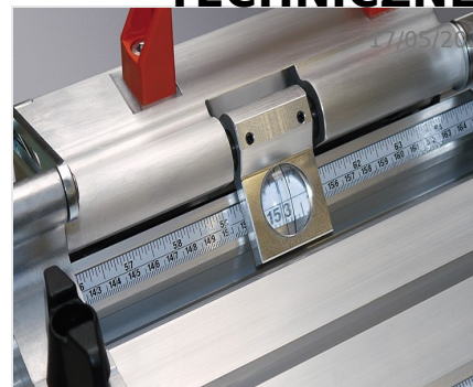
System pomiarowy MMS 200