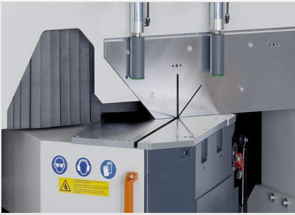
Piła obrotowa MGS 105