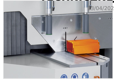
Piła obrotowa MGS 105