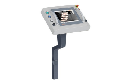
Komputer sterujący E 580