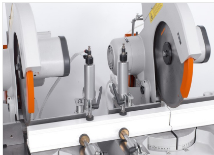
Piła dwugłowicowa DG 79