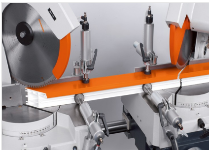
Piła dwugłowicowa DG 79