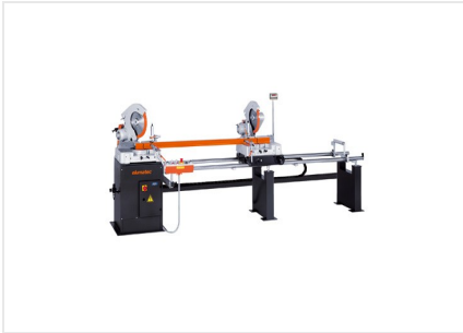
Piła dwugłowicowa DG 79 DG 79 + E 111