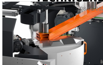
Piła dwugłowicowa DG 104 135°