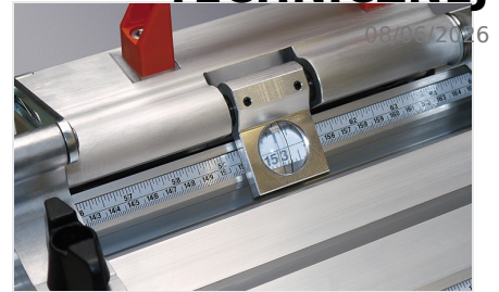
System pomiarowy AMS 200