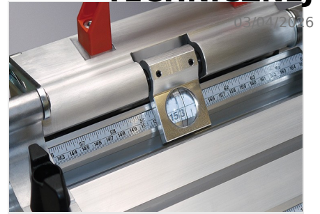
System pomiarowy AMS 200