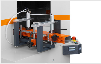
Piły do wycięć klinowych AKS V-550