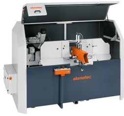
Piły do wycięć klinowych AKS 134/64