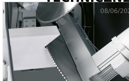
Piły do wycięć klinowych AKS 134/64