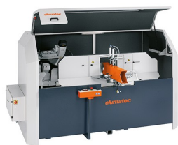
Piły do wycięć klinowych AKS 134/64