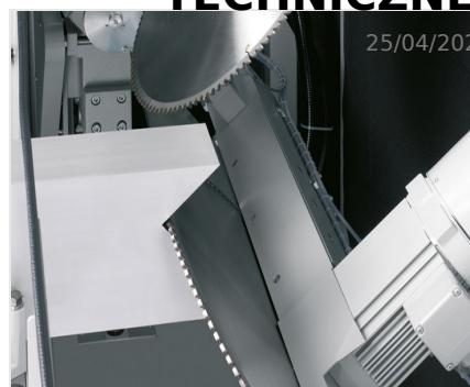
Piły do wycięć klinowych AKS 134/64